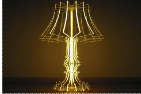
Josephine ( gegraveerd ) Marie-Louise ( normaal )